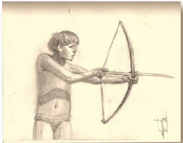
Figura N° 1. Existen diversas corrientes de interpretación acerca de la conquista de América. Obra: La niñez del arco. Dibujo de Ezequiel Gutiérrez.

- Interpretación teológico-pastoral: dentro de esta vertiente es preciso diferenciar la postura de Juan Pablo II avalando la tesis del encuentro entre dos mundos y de Francisco pidiendo perdón por los crímenes contra los pueblos originarios en la conquista de América.