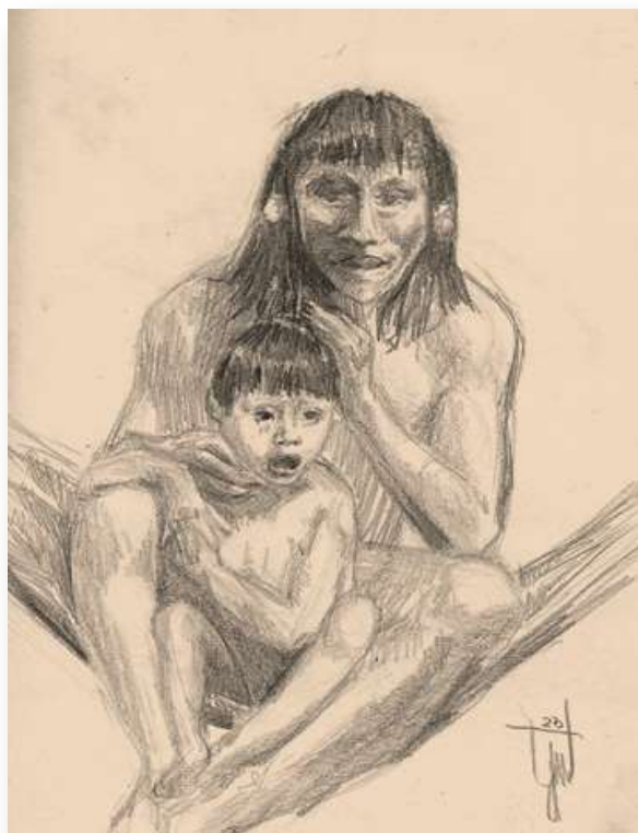
Figura N° 6. La incorporación de prácticas de investigación en el contexto de la formación inicial, ofrece la oportunidad de romper estereotipos vinculados a la memoria histórica y las representaciones sociales de docentes en ejercicio y estudiantes del profesorado de educación inicial. Obra: Generaciones. Dibujo de Ezequiel Gutiérrez.

Por último es oportuno destacar la viabilidad de incorporar prácticas de investigación en el contexto de la formación en el desarrollo académico de las unidades curriculares, como instancias de aprendizaje y de evaluación formativa como modo concreto de vincular dialécticamente teoría y práctica.