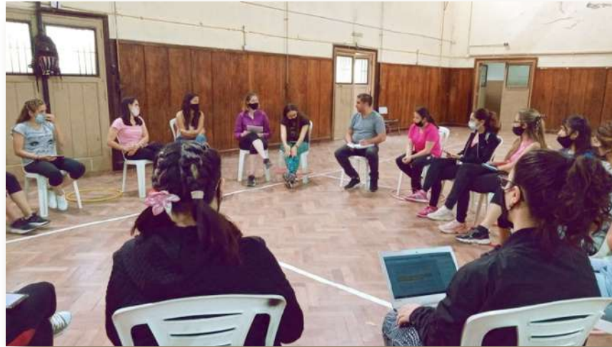
Figura N°4. Realización de la tertulia dialógica en el ISDF y T N°9-003 Normal Superior.

La invitación fue a realizar una Tertulia Dialógica en los términos, principios y premisas que la innovación pedagógica plantea, trabajando sobre la construcción democrática del conocimiento a partir de la relectura de clásicos.